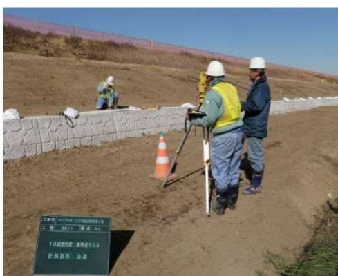
写真撮影例（国土交通省基準より）

②被写体として写しこむ小黒板については、工事名・工種等・TS設置位置及び出来形計測点(測点・箇所)を記述し、設計寸法・実測寸法・略図については省略してもよい。