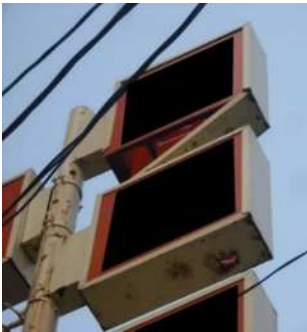
底が剥がれています

美しい広告物も時間の経過とともに老朽化し、放置したままにしておくと、強風などにより重大な落下事故を引き起こす危険性があるため、札幌市屋外広告物条例により、 設置者 や 管理者 には屋外広告物を良好な状態に保持する義務が課せられています。