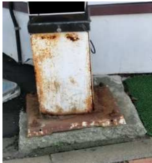
腐食が進んでいます