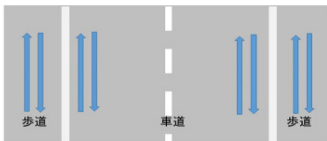
通行位置・方向のイメージ