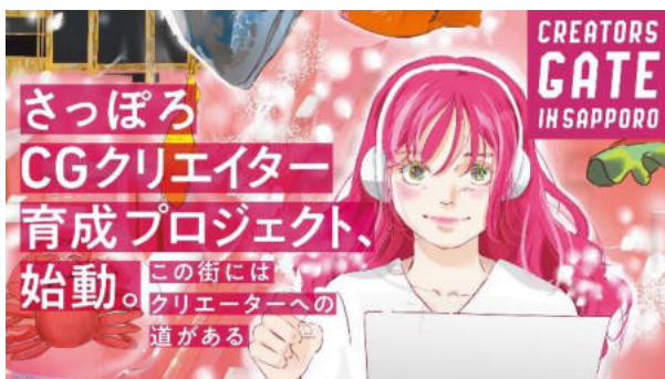
【CG人材育成事業（インターンシップ事業）】