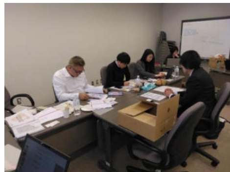
【オーストラリア商談会】