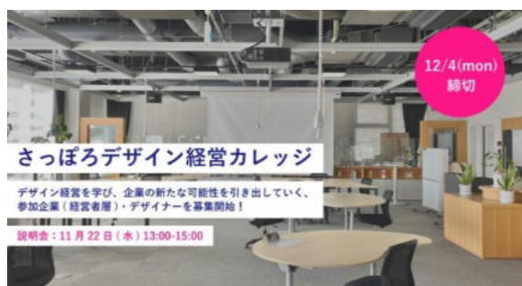
【さっぽろデザイン経営カレッジ】