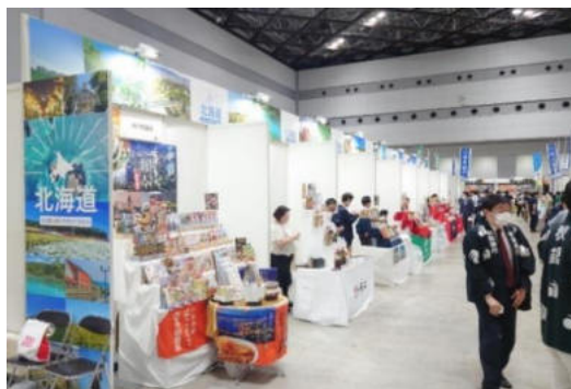
【地方銀行フードセレクション】