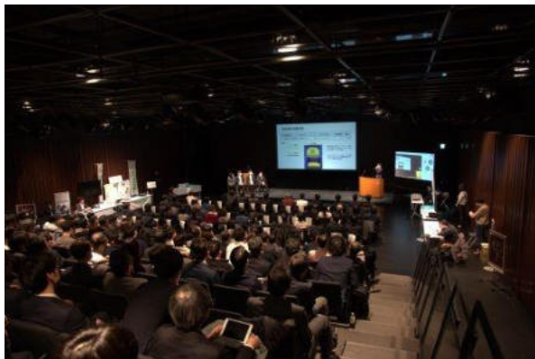
【札幌AI道場 成果発表会】