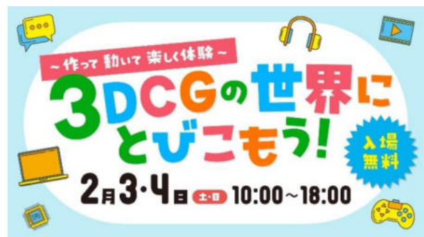
【子ども向けワークショップ】