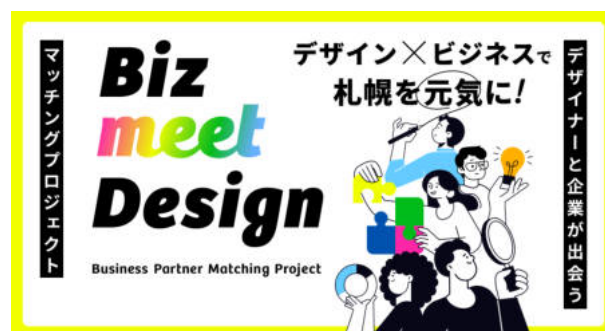
【Biz meet Design】