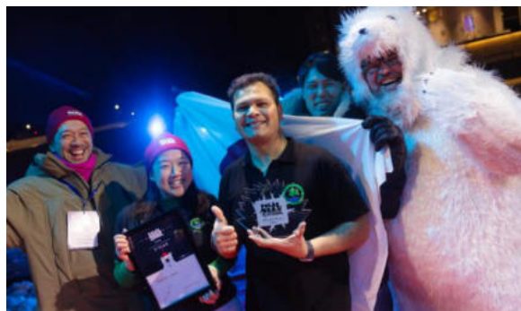
【若者の海外カンファレンス派遣】