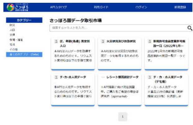
【さっぽろ圏データ取引市場】