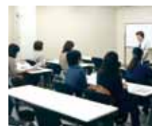
女性向け再就職セミナー