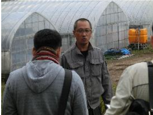
三原社長の話を熱心に聴く参加者のみなさま①

子どもたちにとって、1年を通じた(栽培→収穫→食)就農体験は非常に貴重な体験となることでしょう。