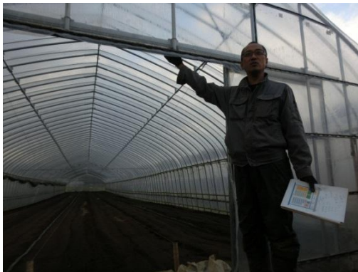
講師の三原社長です。

「『売れるもの』は作れますが『良いもの』を作るのは、なかなか出来ません。」・・・とても感銘深いお言葉でした。