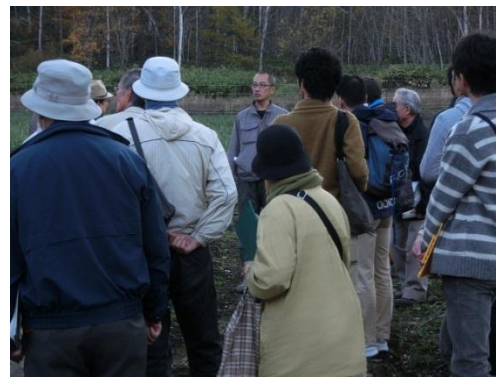
三原社長の話を熱心に聴く参加者のみなさま②