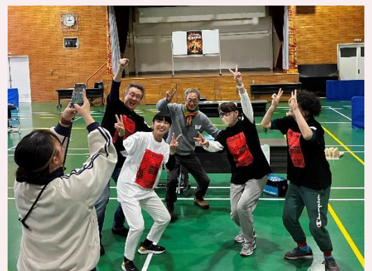
優勝した清田地区商工振興会の皆さま

家族ぐるみでの参加者も多く 商店街の垣根を越えた 若手店主を中心とした 元気いっぱい的大会でした！