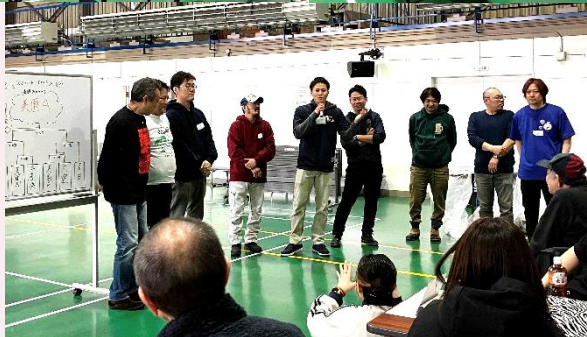
企画・運営に携わった青年部の皆さま

家族ぐるみでの参加者も多く 商店街の垣根を越えた 若手店主を中心とした 元気いっぱい的大会でした！