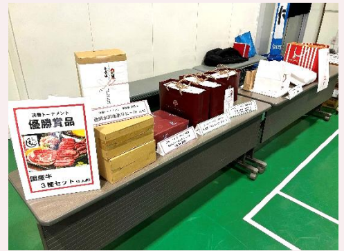
各商店街からの豪華賞品

【参加商店街】 月寒中央商店街振興組合 豊平商店街振興会 南平岸商店街振興組合 平岸中央商店街振興組合 美園商店街振興組合 西岡商工振興会 清田地区商工振興会