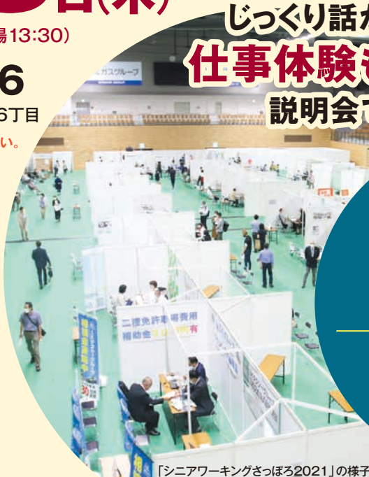
「シニアワーキングさっぽろ2021」の様子