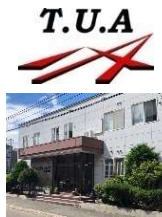
T.U.A 東陽上村アドバンス(株)(札幌市) 創立：昭和3年 従業員数：64名 事業内容：コンクリート製品製造・販売、土木工事資材の販売

現在は、札幌学院大学の客員教授として、経済経営学部の学生に「ITコーディネータ論」を教えるほか、中小企業大学校旭川校にて商工会議所・商工会の経営指導員対象の「DX導入支援の進め方研修」講師、道内製造業のIoT導入支援講師(ノーステック財団、札幌市)や情報セキュリティ、事業継続力強化計画・事業継続計画(BCP)などの講演・研修・コンサルティングを行っている。