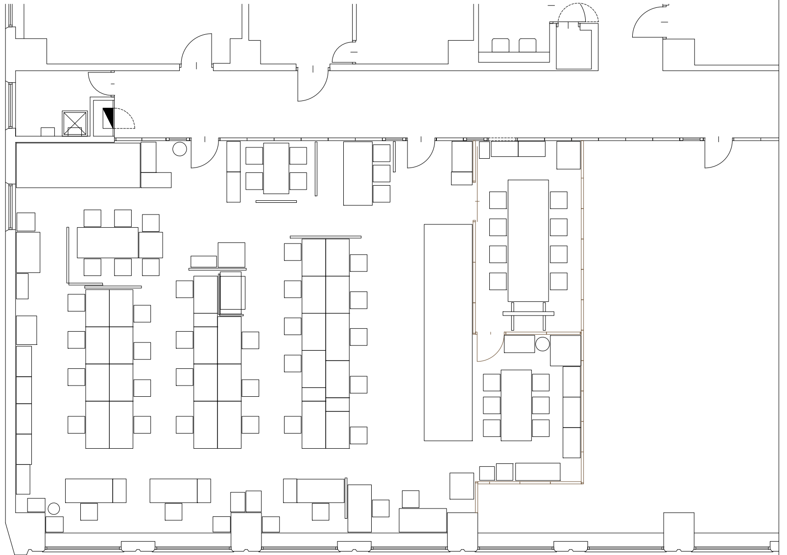
札幌市 農政課 現状レイアウトイメージ図