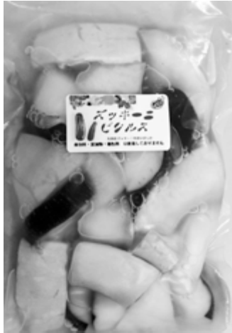
ズッキーニピクルス

平成24年10月4日（木）に、今年度第1回となる「さっぽろとれたてっこ」認証委員会が開催されました。「さっぽろとれたてっこ」の畜産物として「肉豚」が、加工品として「ズッキーニピクルス」と「大浜みやこ（カボチャ）のペースト」が新たに認証され、認証畜産物は3件、認証加工品は11件となりました。