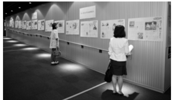
札幌の生産者を紹介するコーナー