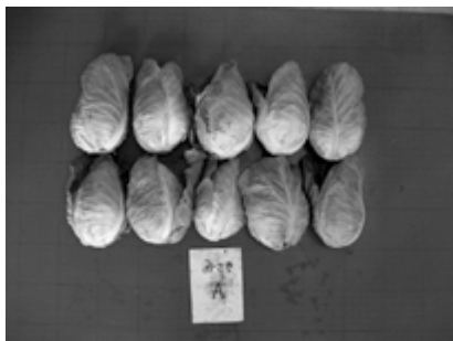
ミニキャベツ（みさき）