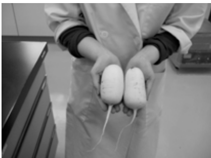
ミニダイコン（ころ愛）