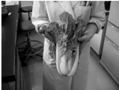
ミニハクサイ（娃娃菜）