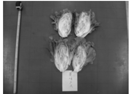
ミニレタス（美味タス）半割写真