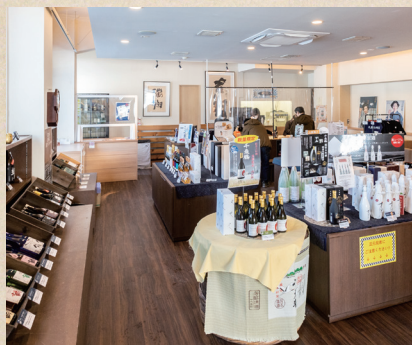
千歳鶴酒ミュージアム