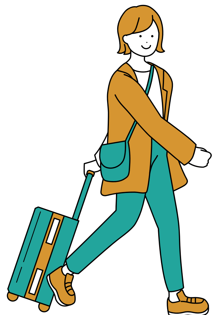
旅先でタクシーに の乗ったり