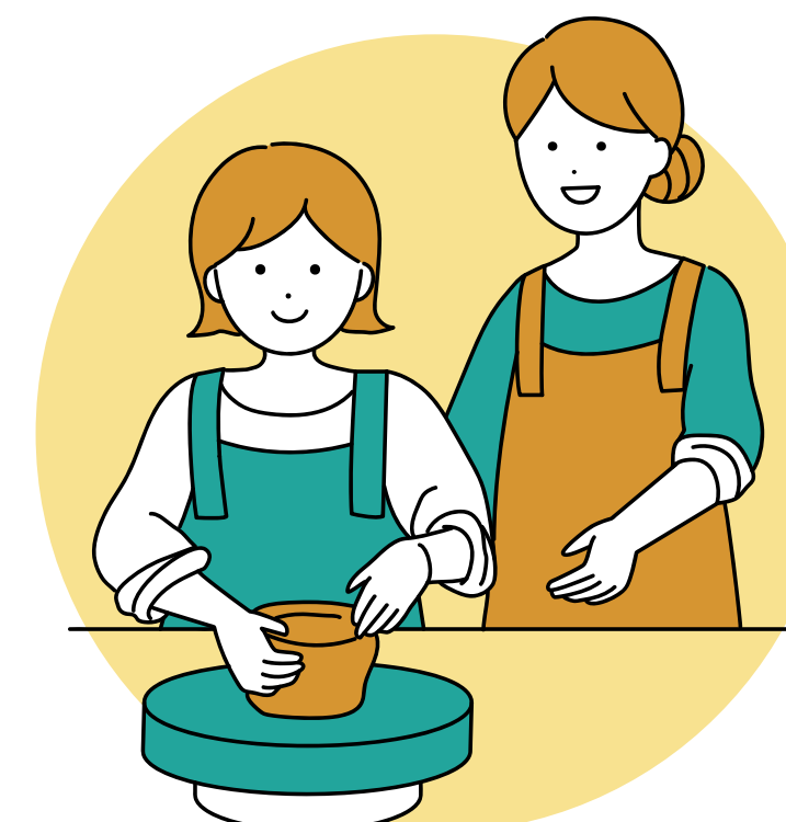
[体験プログラム業]