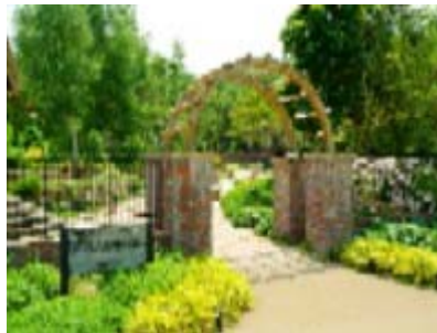
滝野すずらん丘陵公園

1位は滝野すずらん丘陵公園、2位は円山動物園、3位は大倉山ジャンプ競技場でした。