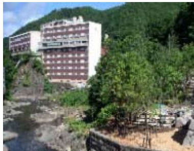
豊平川に隣接する整備中の「定山溪源泉公園」