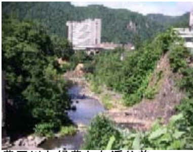
豊平川と緑豊かな溪谷美