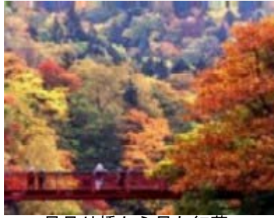
二見吊り橋から見た紅葉

定山溪温泉では、当地の開祖「定山坊」の生誕200年を記念して、地域を挙げての取り組みにより、新たな魅力が展開されています。