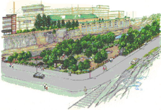
定山源泉公園完成予想図