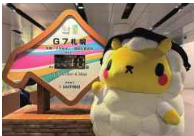
10日前・3日前にカウントダウンを投稿