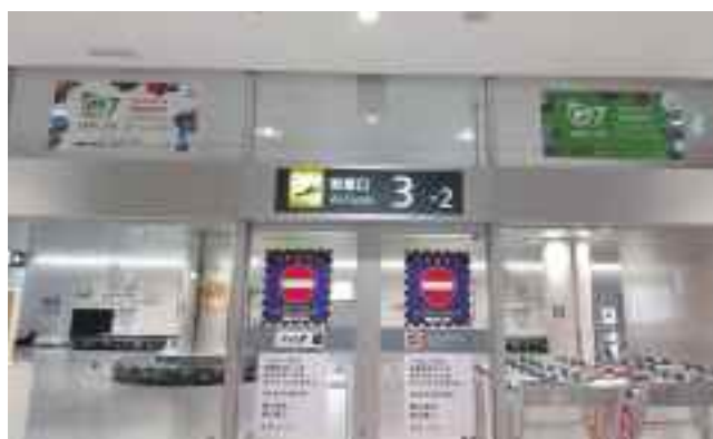
新千歳空港 到着口