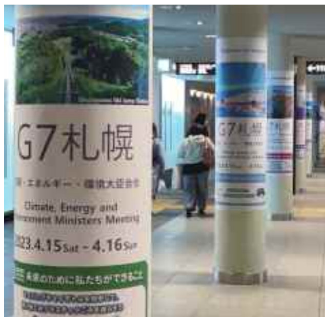
札幌駅前通地下歩行空間