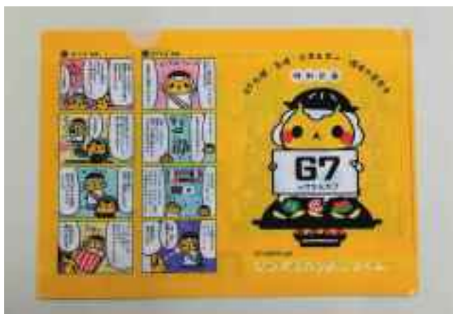
撮影会参加者に配布したクリアファイル