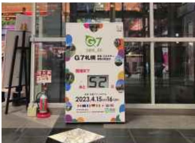
3月9日までの設置状況(エレベーター横)