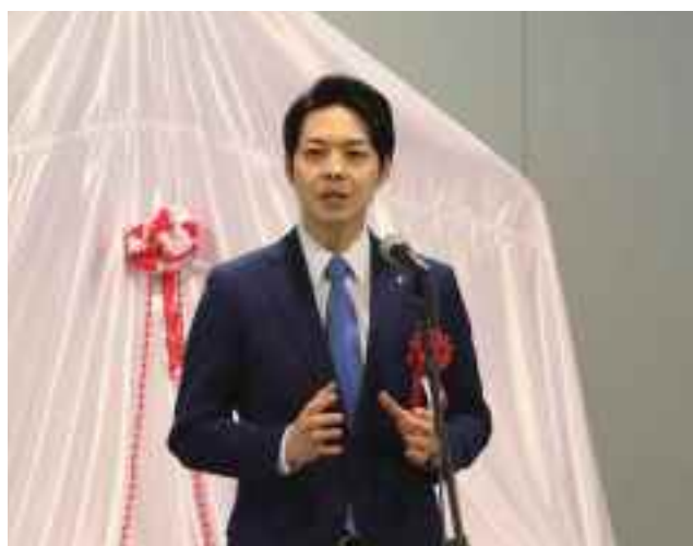
鈴木北海道知事による挨拶