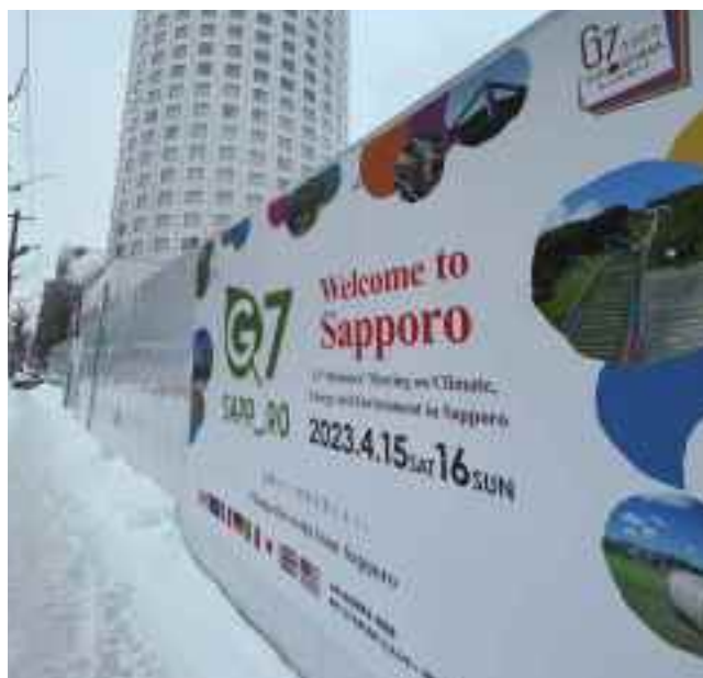
中央区複合庁舎工事現場仮囲い

来道される各国代表団や報道関係者に歓迎の意を伝えるため、新千歳空港の到着口や大臣会合の会場である札幌プリンスホテル周辺などに歓迎装飾を行ったほか、大臣会合開催の周知と機運醸成のため、シートを制作して札幌市内各所に掲出した。