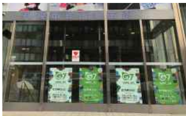
札幌市役所本庁舎北玄関