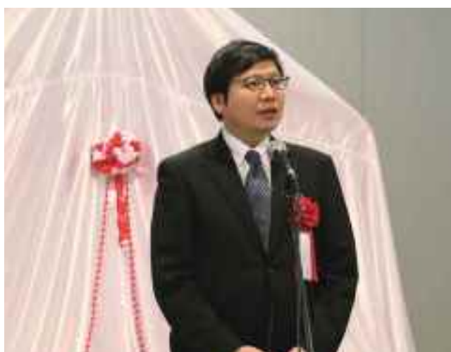
森本サッポロビール株式会社 北海道本社代表による挨拶