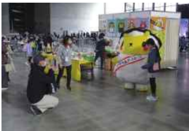
記念撮影会を実施