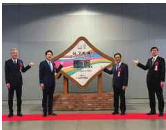
カウントダウンモニュメント