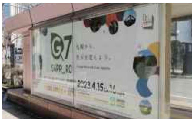
札幌駅前通地下街出入口