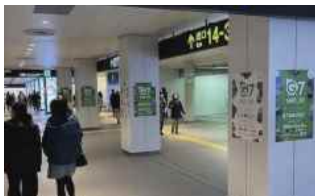
地下鉄大通駅コンコース