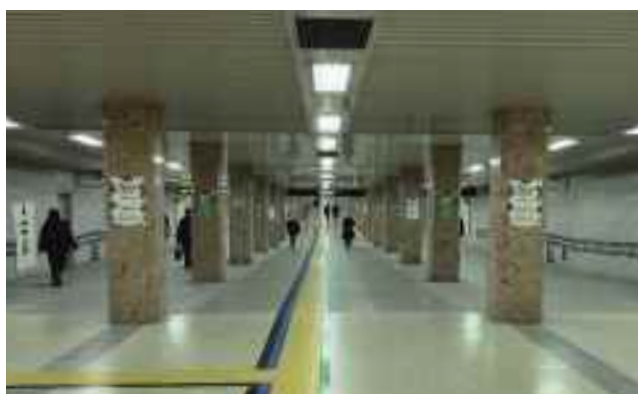
地下鉄さっぽろ駅コンコース