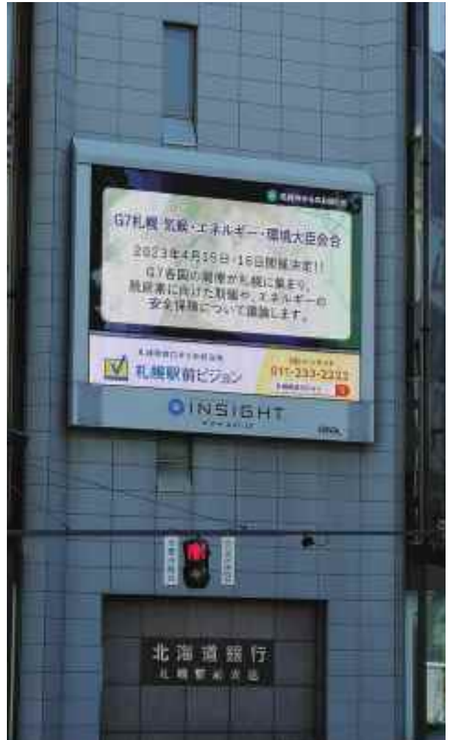
札幌駅前ビジョン