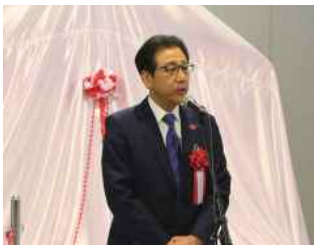
秋元札幌市長による挨拶