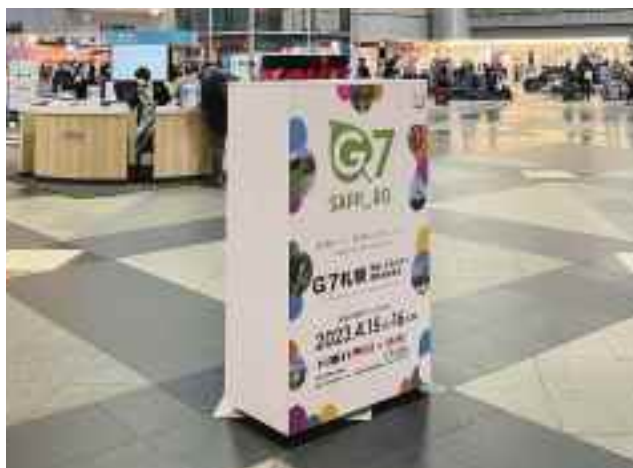
3月10日移設以降の設置状況