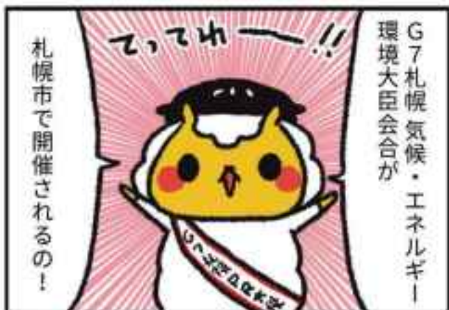
4コマ漫画で大臣会合を紹介