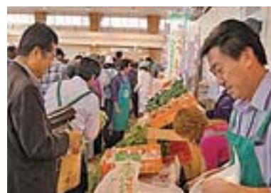
さっぽろハーベストランド秋祭りの様子

内容：農畜産物直売コーナー、「ゆめぴりか」他新米の販売・食べ比べ、09農村体験inさとらんど(同時開催イベント)、市町村の地元食材を使用した料理提供(4店舗)、さとらんどの遺跡展