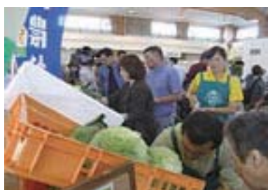
さっぽろハーベストランド収穫祭の様子