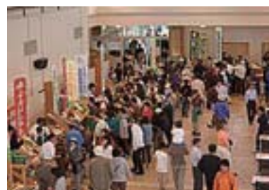
さっぽろハーベストランド誕生祭の様子

内容：開会式、農畜産物直売コーナー、ステージイベント(野菜ソムリエの料理教室、ゲーム大会、抽選会等)、市町村の地元食材を使用した料理提供(4店舗)