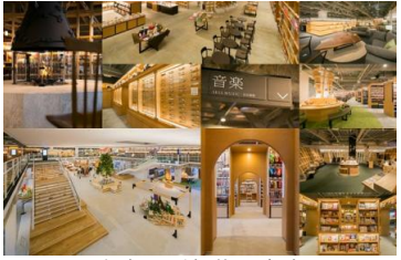
参考:函館 蔦屋書店

例えば、「函館 蔦屋書店」は、木の温もりを感じる館内で、本を中心としながら、音楽・雑貨・コスメ・生花・食・知育玩具等、高感度で豊かな生活を提案し、地域住民に向けた文化・教育イベントにも力を注いでいる。大人向けのイベントはもちろん、子供に向けた読み聞かせや音楽教室等を開催し、地域住民との強い繋がりを感じさせる。通常の図書館等にはない、新しい文化の場が体现されており、こうした施設があれば、「周辺に住みたい」「子育てをしたい」と思わせるのに十分な魅力を感じる。