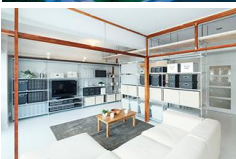
参考:無印良品住宅の例

例えば、幅広い年齢層から支持される「無印良品」の団地リノベーションプロジェクト「MUJI×UR」等の活用による公団再生はどうだろう。自然と調和し、親しみやすい普遍的なデザインとエコの視点から、多くの人々の共感を得られ、「住みたいまち」への一助となると考える。