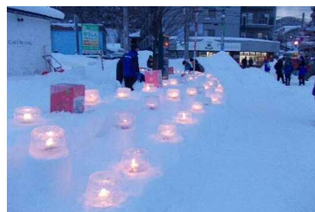
もいわ山麓ゆきあかり