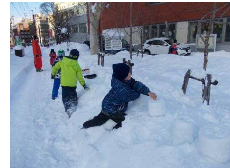
二条の雪あかり(スノーキャンドルづくり)