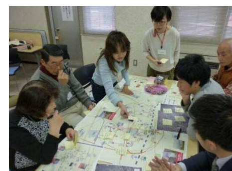
苗穂まちなみスクール