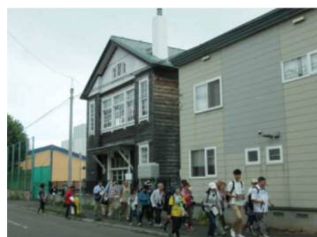
苗穂まちなみ探検隊