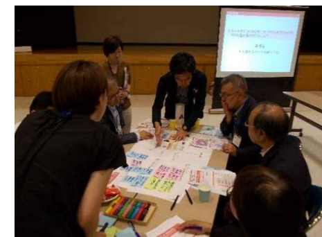
景観まちづくりワークショップ