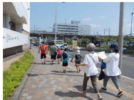
新さっぽろみっけ！まち歩き BINGO