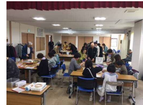
ラベンダークラフト講習会