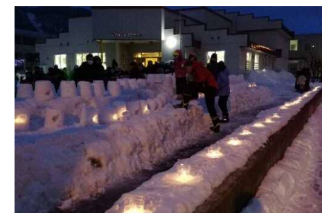
ゆきあかりのみち 2020