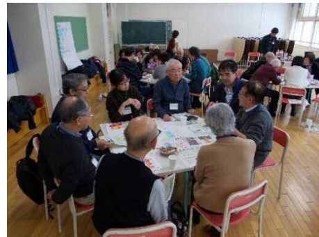
MOIROKU Lab (モイロクラブ)