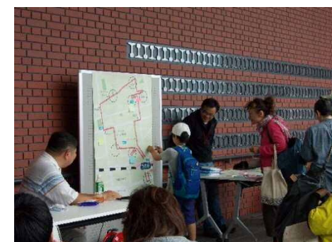
まちの景観資源の抽出