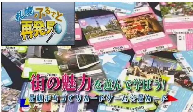
広報番組 (さっぽろふるさと再発見)