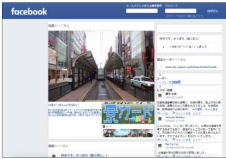
好きです。さっぽろ（個人的に。） 運営委員会 Facebook