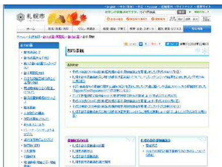
都市景観係ホームページ