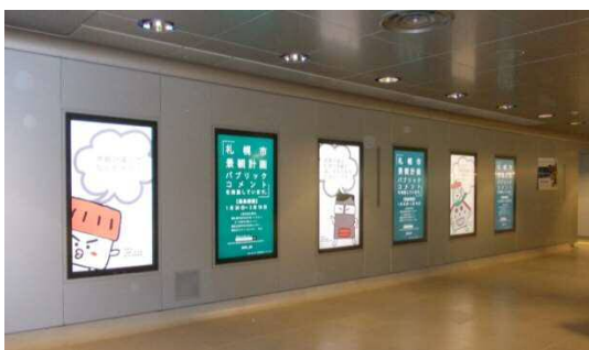
デジタルサイネージ (チ・カ・ホ内 north2)