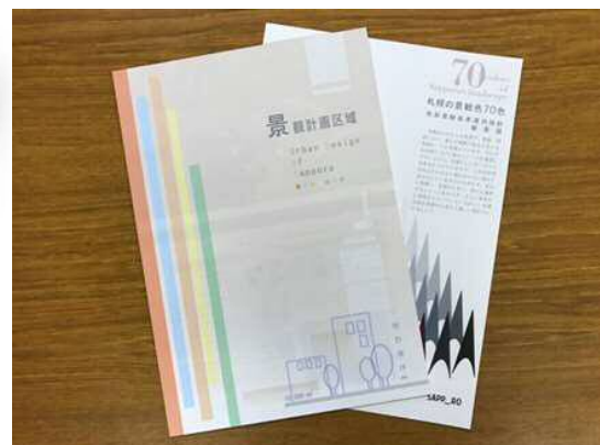
パンフレット (市民向け)