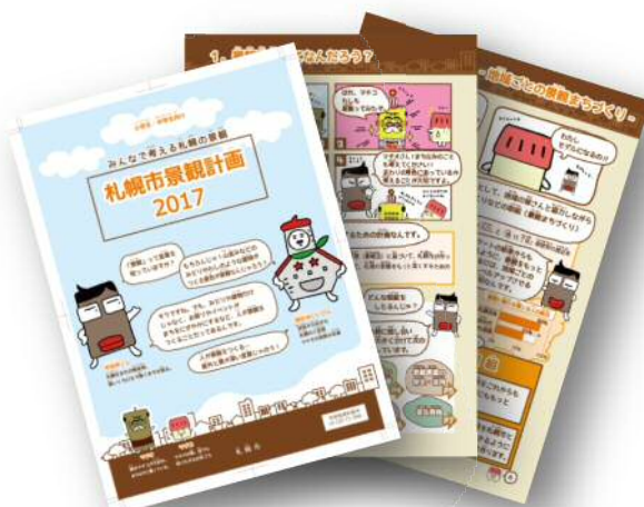
パンフレット (子ども向け)