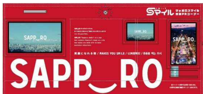
サップロスマイル市政 PR コーナー (大通駅コンコース)