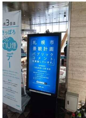
デジタルサイネージ (市役所正面玄関 電子掲示板)