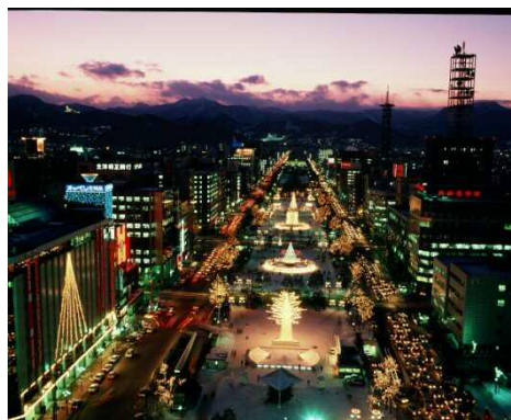
第2回 ホワイトイルミネーション サっぽロプラザ