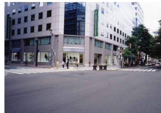
第11回 ベネトンメガストア札幌