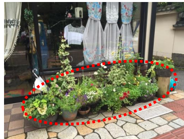
建築物の外構部分を積極的に緑化している例