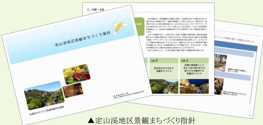
▲定山溪地区景観まちづくり指針

これからは地域の魅力向上につながる景観まちづくり活動にみんなで取り組んでいきましょう。