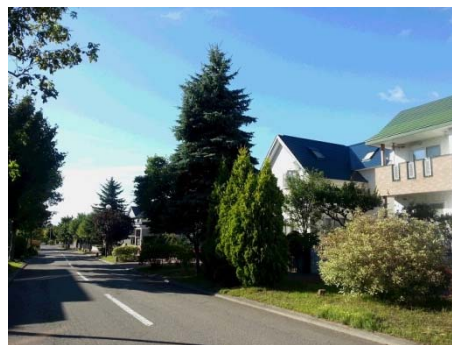
郊外の住宅地（清田区）

地域の魅力ある景観づくりを積み重ねることで、札幌全体の景観の魅力を高めることを目指します。