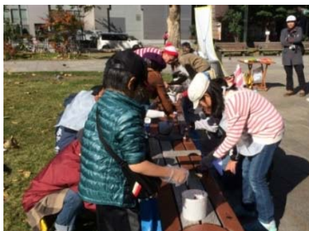
市民の手によるベンチ塗り替え（大通公園）

札幌全体の景観を魅力的にするため、多様な主体が絶えず取組を積み重ねていくことを目指します。