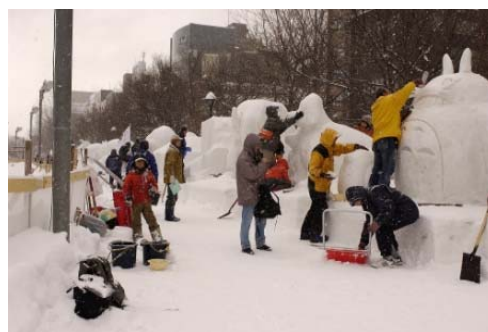
市民の手による雪像づくり（さっぽろ雪まつり）

多様な主体が良好な景観の形成に向けて取り組み、その過程と成果を発信することで、取り組みの輪を広げていくことを重視します。