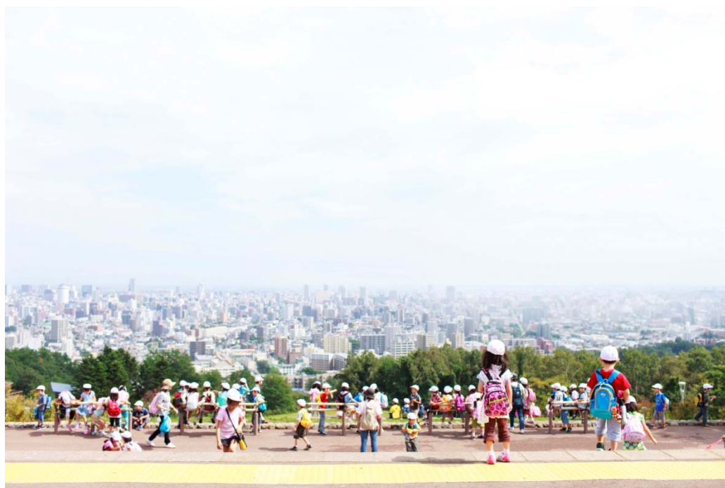
旭山記念公園から都心部を望む