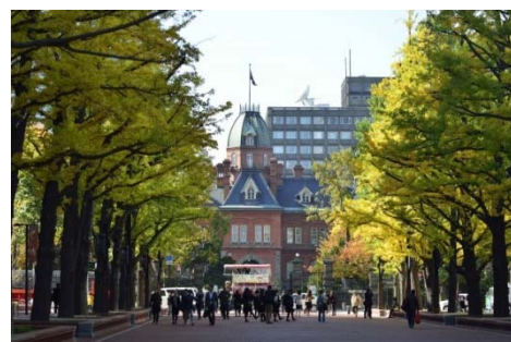
北3条広場と北海道庁旧本庁舎（旧赤れんが庁舎）

札幌らしい景観を形成するために、こうした歴史を読み解き、生かしながら未来へ受け継ぐことを重視します。