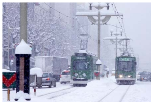
路面電車が走る冬の街並み

地域によって異なる街並み、特徴的な山並みや公園などを個性ととらえ、生かすことで、地域の景観の魅力を高めることを重視します。