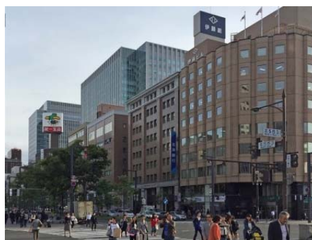
札幌駅前通の街並み

札幌全体の景観特性を踏まえることはもとより、地域ごとの街並み形成の履歴や現況を読み解き、これらに対して違和感のない、つり合いのとれた景観づくりを目指します。