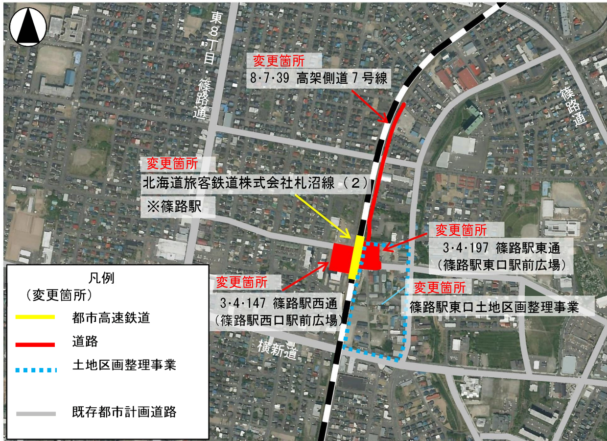
図1 都市高速鉄道・道路・土地区画整理事業の都市計画変更箇所