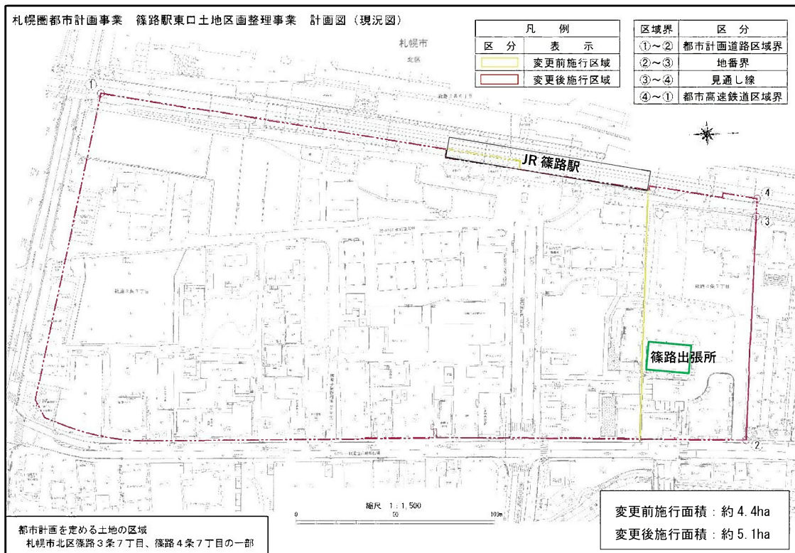
図4 土地区画整理事業区域の変更