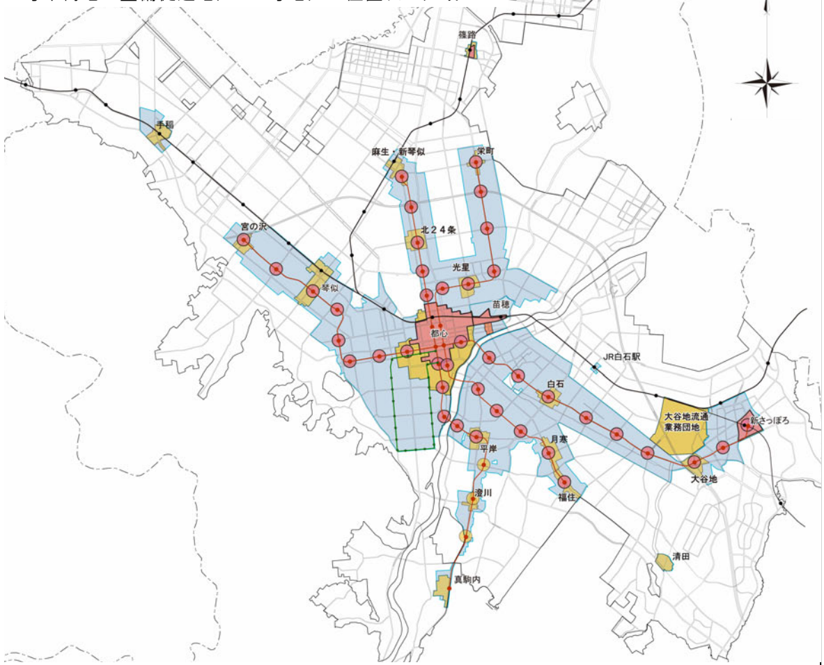
1号市街地・整備促進地区・2号地区の位置及び区域

※「事前説明第1号」の内容は、「事前説明第1号関係資料①」（パブリックコメント用資料）のうち、都市計画決定事項を示したものです。