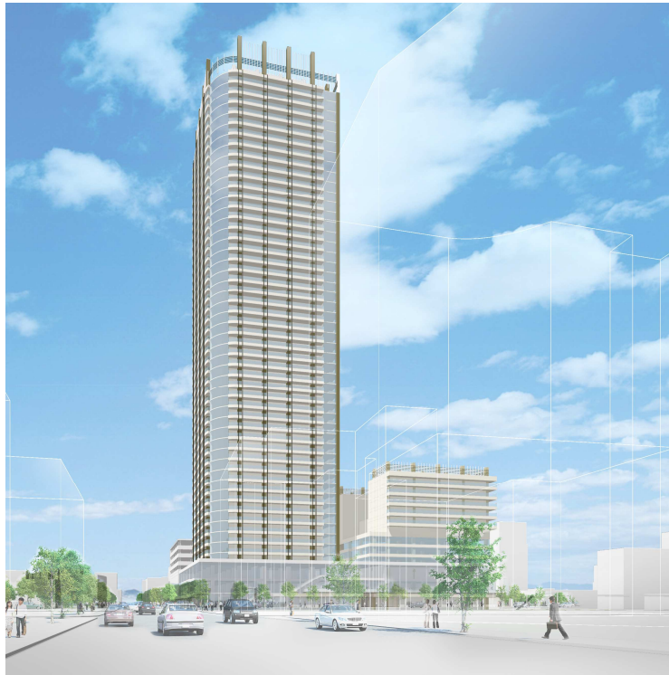
～ 南西側から見たイメージ ～