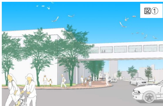
空中歩廊5号（道路横断面）