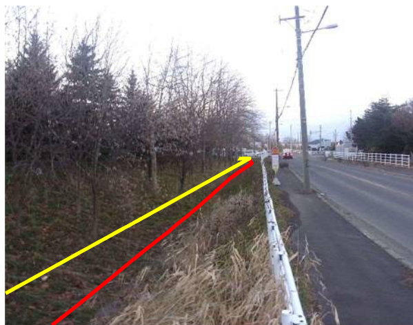
写真：道路移管区域から曲線部を北東に望む