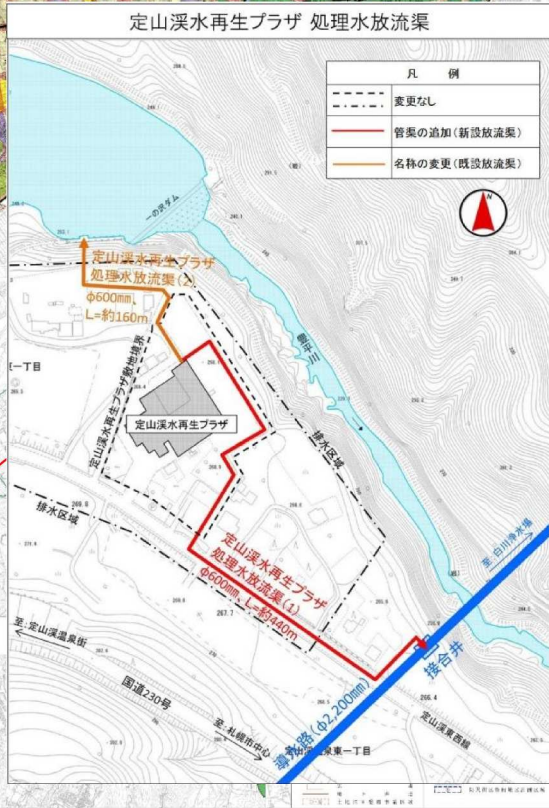
定山溪水再生プラザ 処理水放流渠