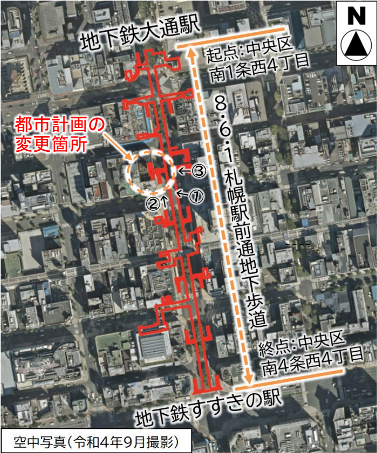
空中写真(令和4年9月撮影)