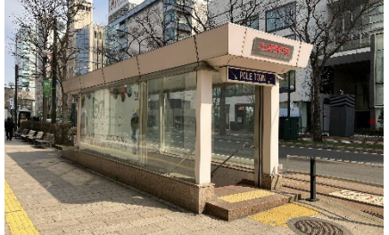
②歩道上の地下街出入口