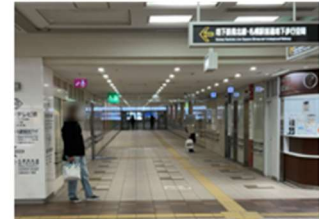
②オーロラタウンより