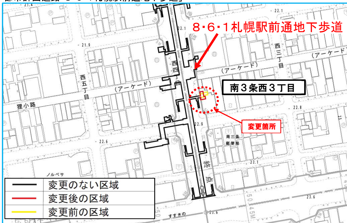
都市計画道路「8・6・1札幌駅前通地下歩道」