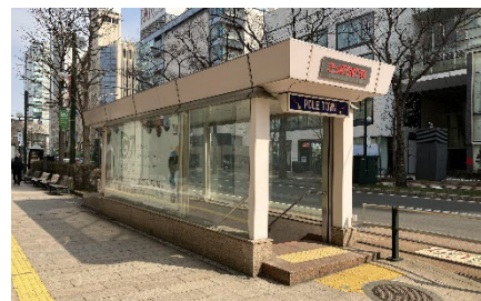
②歩道上の地下街出入口