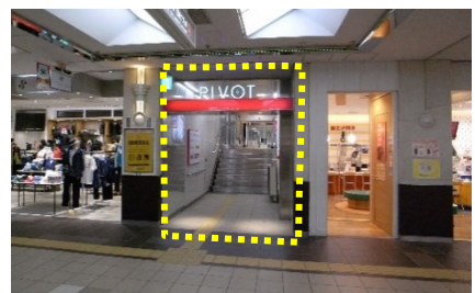
③地下街からの出入口