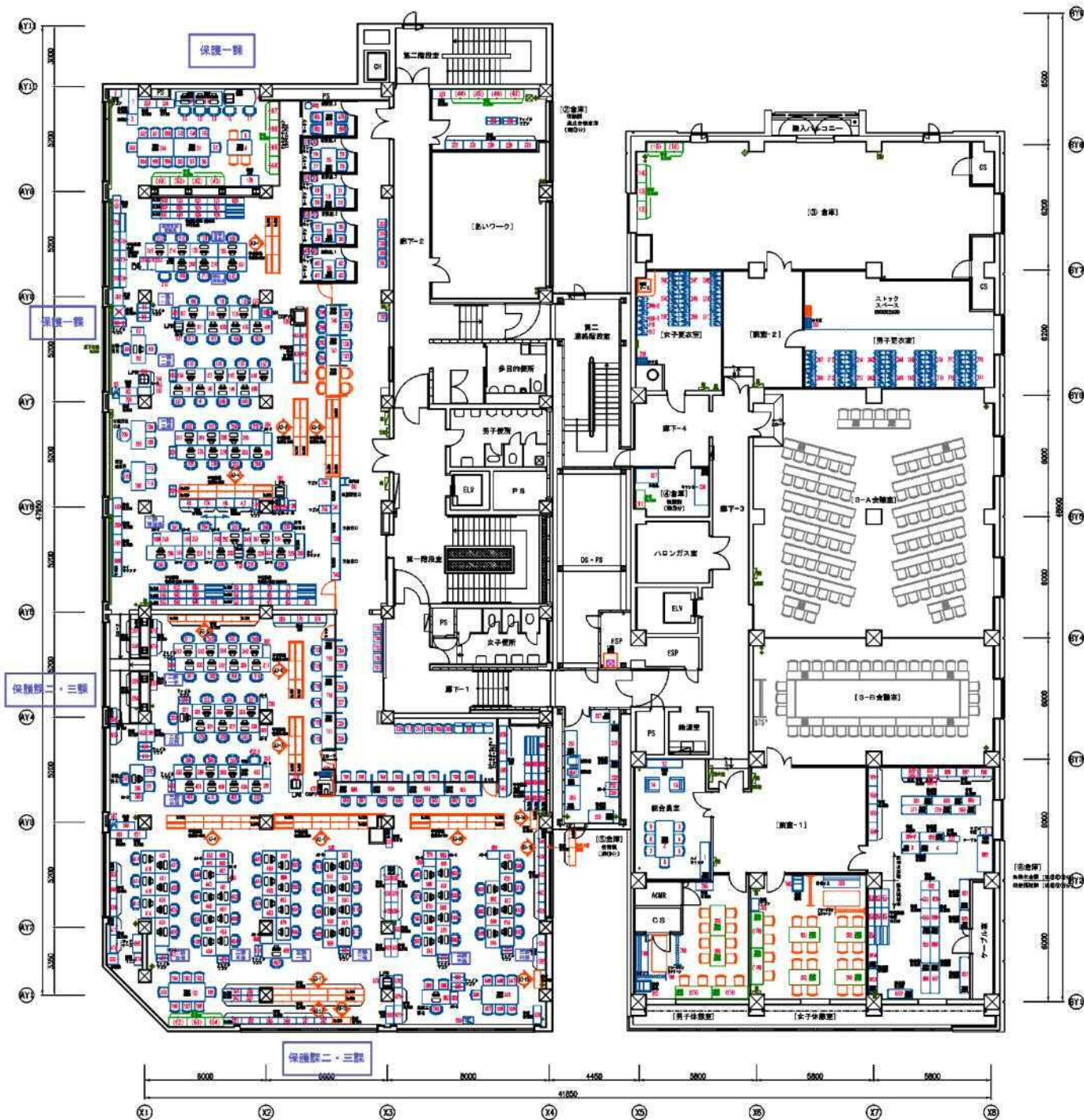
札幌市 中央区役所 仮庁舎 3Fレイアウト SCALE : 1/200 (A3)