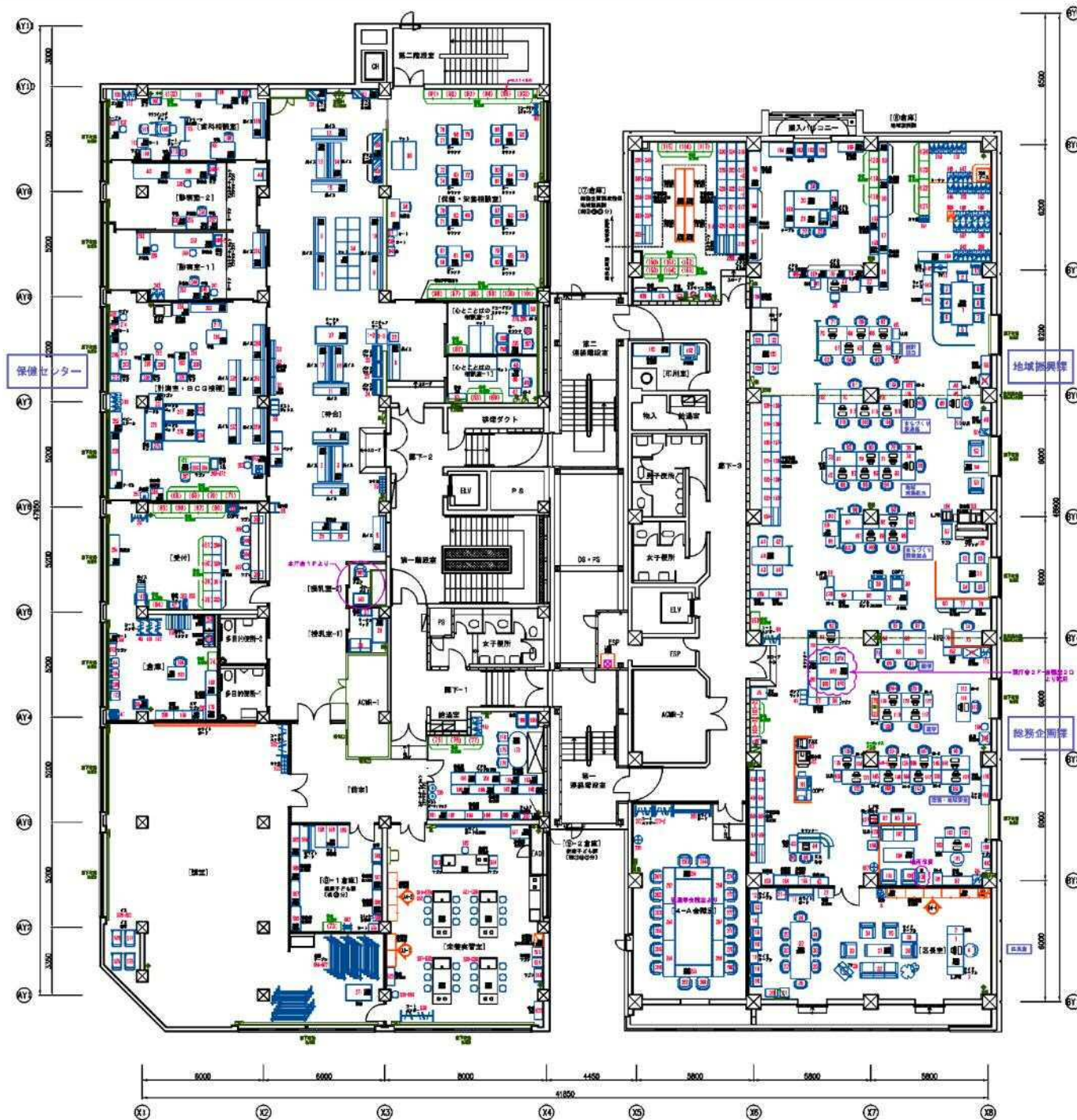
札幌市 中央区役所 飯庁舎 4F レイアウト