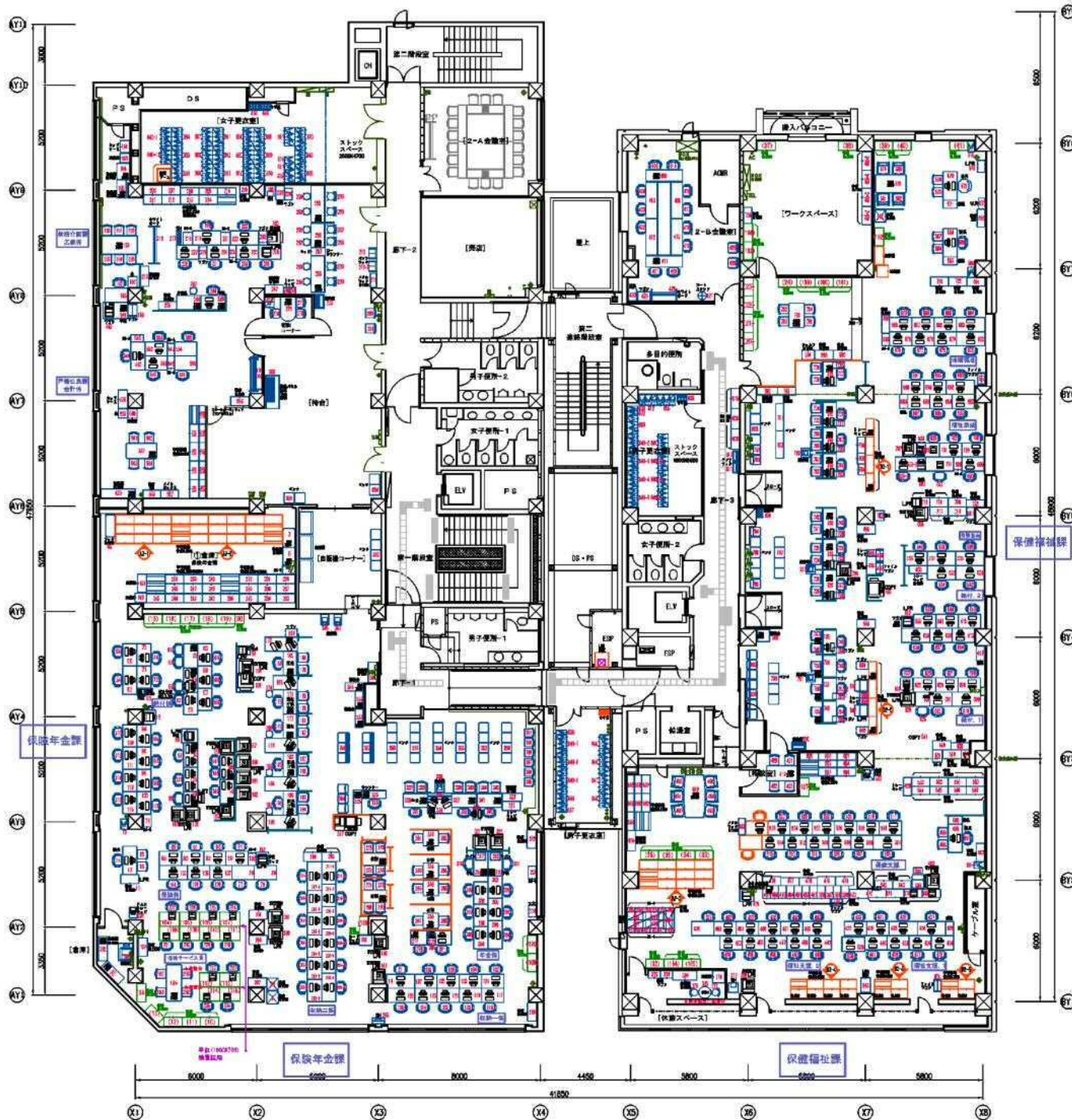
札幌市 中央区役所 仮庁舎 2Fレイアウト