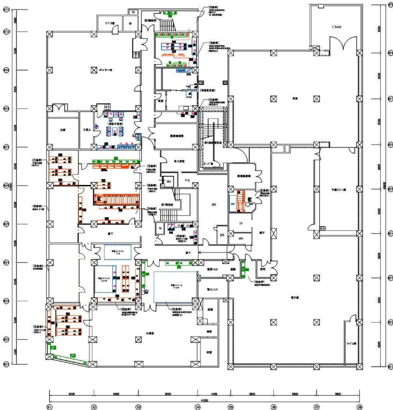
札幌市 中央区役所 飯庁舎 B1レイアウト