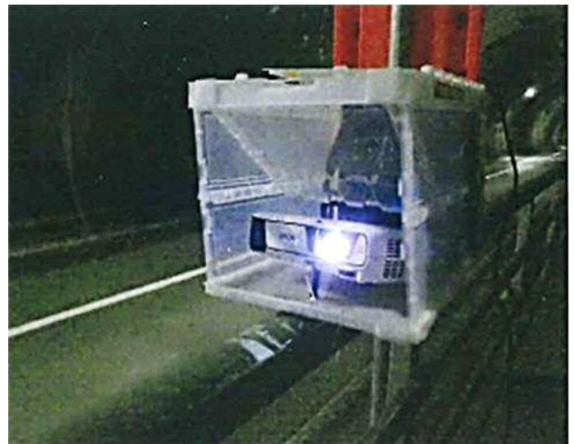
写真2 トンネル内上部にプロジェクターを利用し規制表示等を映し出した優良事例