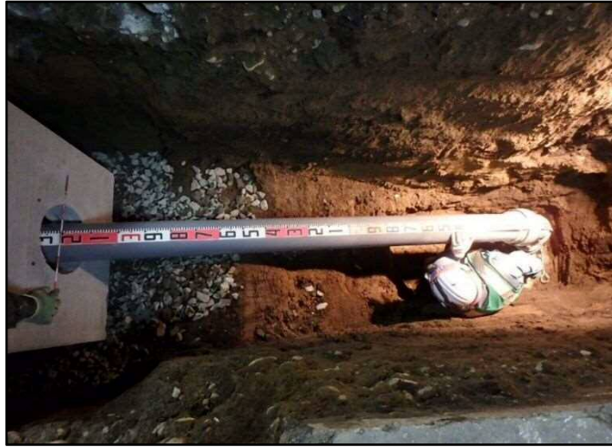
写真1 土留工等の安全対策を実施せずに作業を行った事例