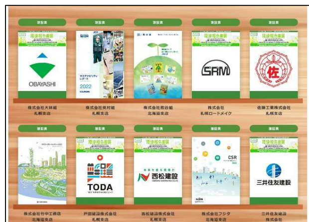
札幌ゼロカーボン推進ネットワークホームページ