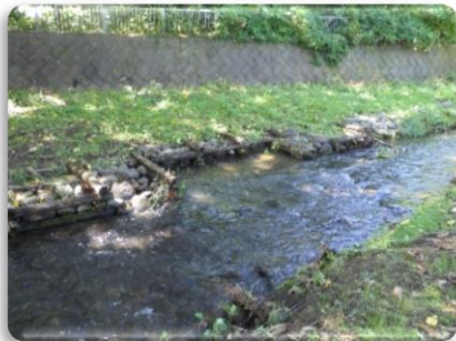
人工的に造られたワンド