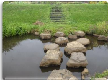
飛び石の周りも水生生物が身を潜められるポイントです。