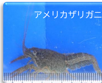
特定外来生物のアメリカザリガニ(幼体)