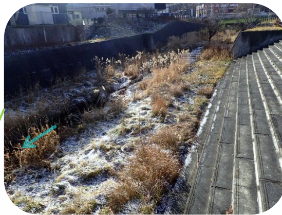
左岸にある階段状の護岸が広く、川へ容易にアプローチできるため、環境活動の場として利用できます。