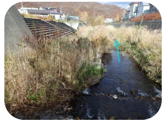
河岸には背の高い植物が繁茂しています。