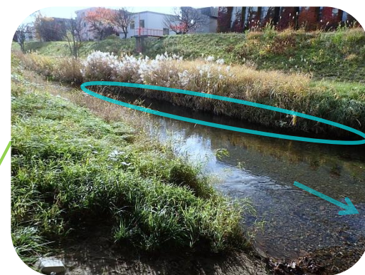
河岸には植物が繁茂しています。植物の根元は掘れており、魚が生息しています。