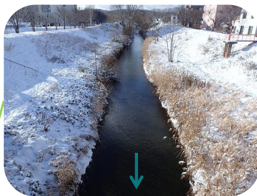
両岸の河岸は広いため、環境活動の場として利用できます。