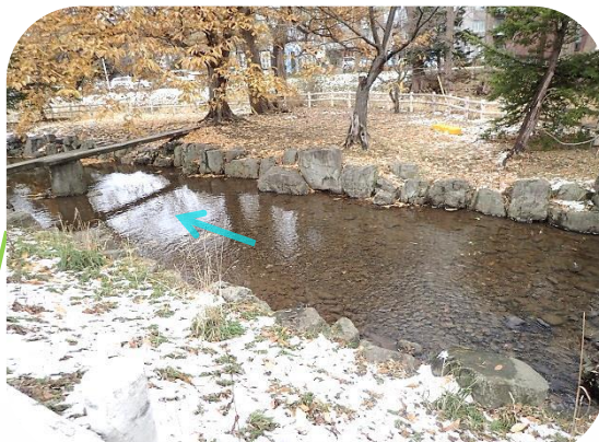
水深は浅く、河岸は広いため、環境活動の場として利用できます。