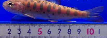
サクラマス(ヤマメ)

ウグイ、サクラマス(ヤマメ)、ハナカジカ等が生息しており、植物や河床の礫の隙間に生息しています。