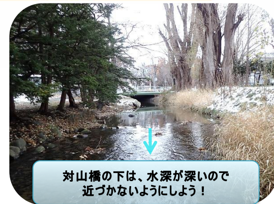
対山橋の下は、水深が深いので近づかないようにしましょう!