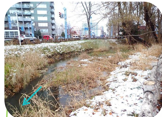
右岸側は、植物が繁茂しており、その隙間に魚が生息しています。