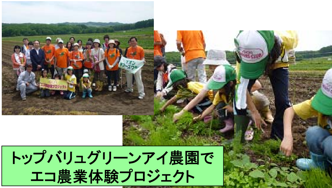
トップバリュグリーンアイ農園で エコ農業体験プロジェクト