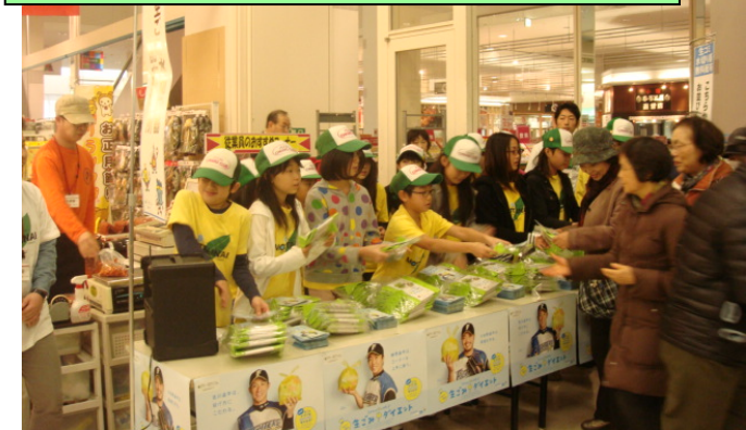
行政への協力 (生ゴミ水切り器店頭配布)