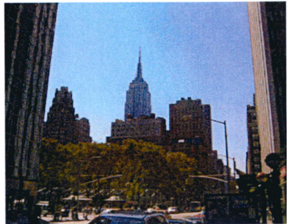
米国・ニューヨーク (イノヴァ・ストリート付近)