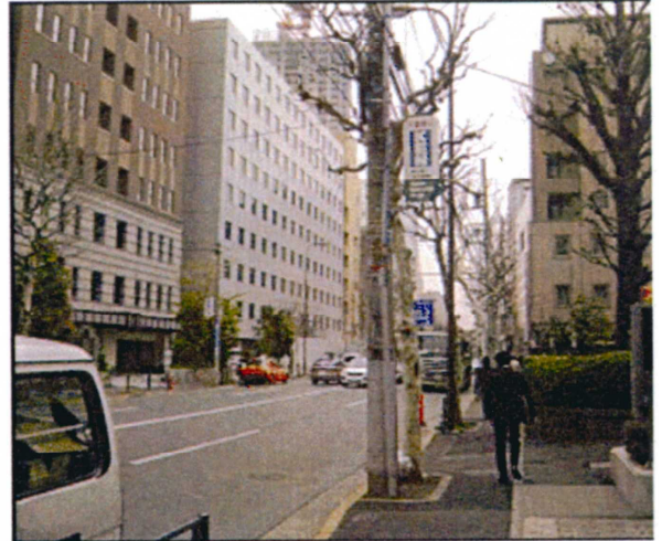
東京都港区赤坂8丁目 (外苑東通り)