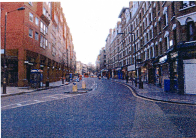
英国・ロンドン (ピカデリーサーカス付近)