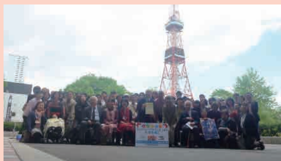
フェアトレードタウン認定式

る、という6つの条件を満たしている必要があり、札幌市は2019年6月に日本で5番目のフェアトレードタウンに認定されています。