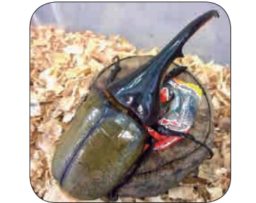
ヘラクレスオオカブト