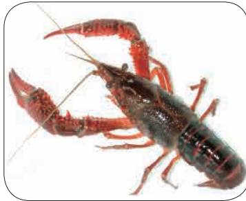
アメリカザリガニ