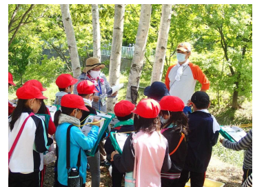
(実際の派遣の様子)