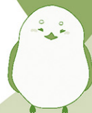
シマエナガちゃん※

温暖化の影響で、暑すぎる日が続いたり、強い台風や大雨が増えたり、 逆に雨が降らなかつたりと、私たちの生活だけでなく、 野生の生き物たちのすみかにも影響を与えているんだ。