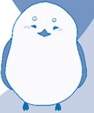
シマエナガちゃん※

温暖化の影響で、暑すぎる日が続いたり、強い台風や大雨が増えたり、 逆に雨が降らなかつたりと、私たちの生活だけでなく、 野生の生き物たちのすみかにも影響を与えているんだ。